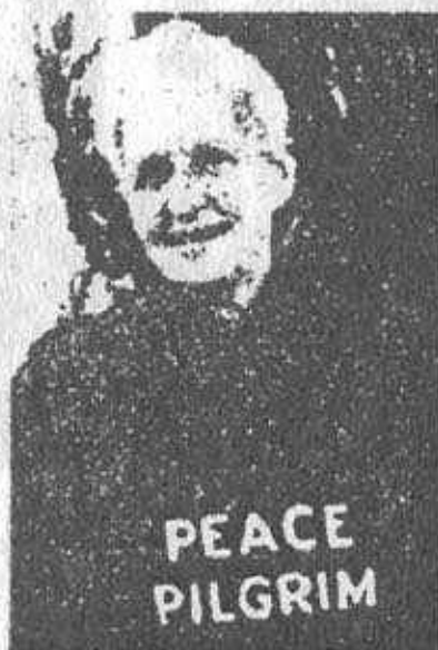
MODERN-DAY PILGRIM She has a mission

But world developments have not changed my pilgrimage. Peace is much more than the temporary absence of war; it is the absence of the causes of war. I believe it will take another 10 years for an outer peace to develop and sustain itself, but even after that time I will continue to talk about the inner peace man needs to maintain outer peace." She says her pilgrimage is not supported by any group.