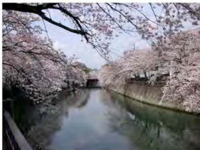
Flor de Cerezo en Tokyo Foto de Eriko Katsuo, Japón