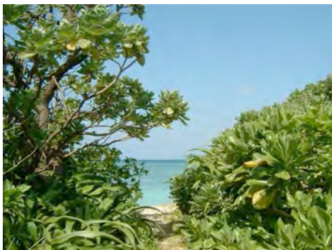
Okinawa, Japón Foto de Eriko Katsuo, Japón

Tengo un jardín lleno de pájaros Cantando canciones de amor y dolor Mientras tienen una comida gratuita, Acariciados por el viento y benditos por la lluvia, Recordándonos a todos del sol.