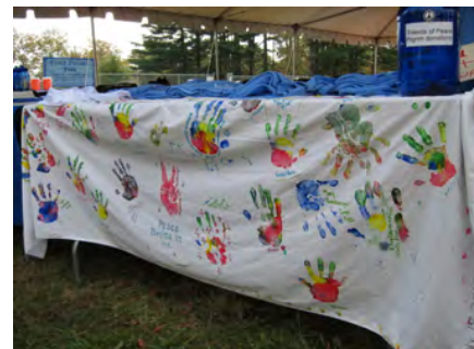
"Paz Comienza Conmigo" Celebración 2011 de Peregrina de Paz