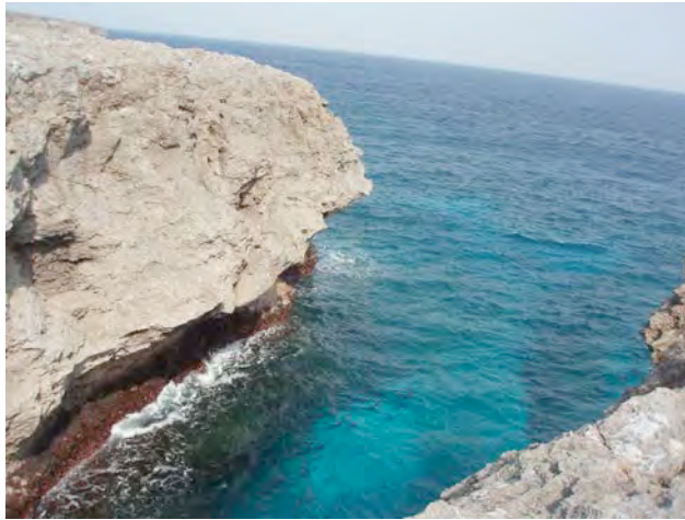
Okinawa, Japón 2011 foto por Eriko Katsuo, Japón

Un país que valora la Armonía y el Respeto.