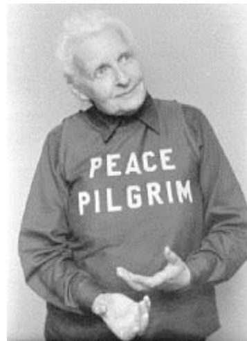
Peregrina de Paz

Swami Garfield Jansen, Coimbatore Tamil Nadu, India